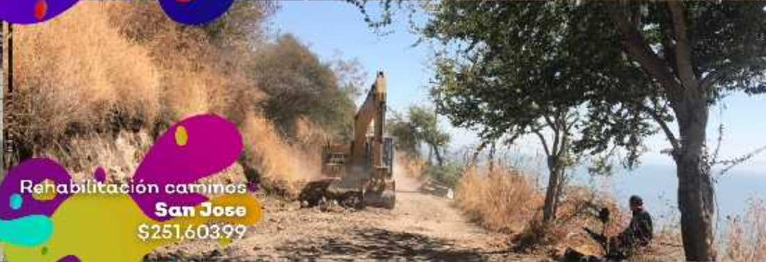
Rehabilitación caminos San Jose $251,603.99