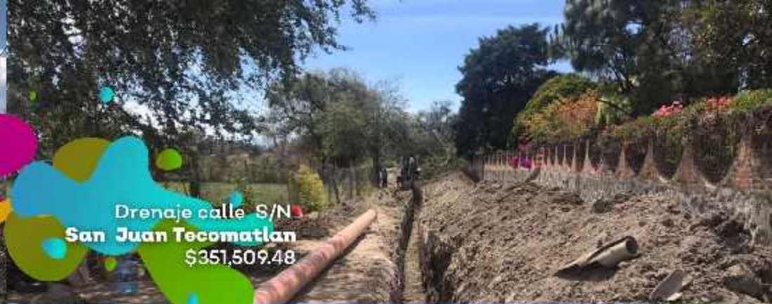
Drenaje calle S/N San Juan Tecamatlan $351,509.48