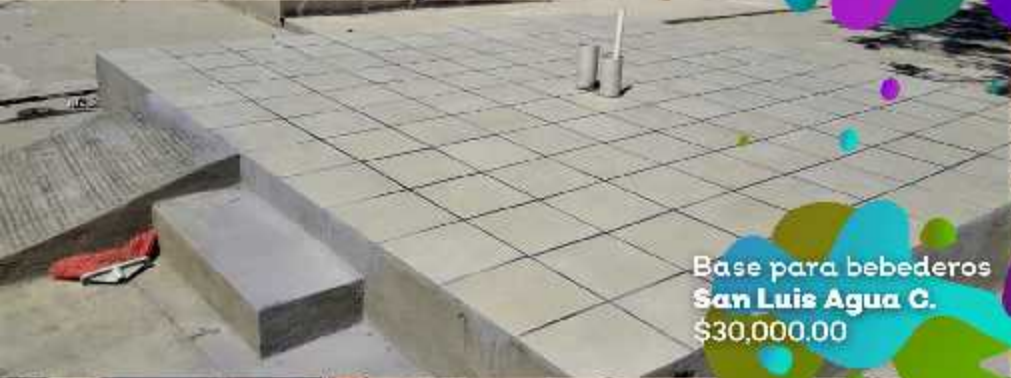
Base para bebederos San Luis Agua C. $30,000.00