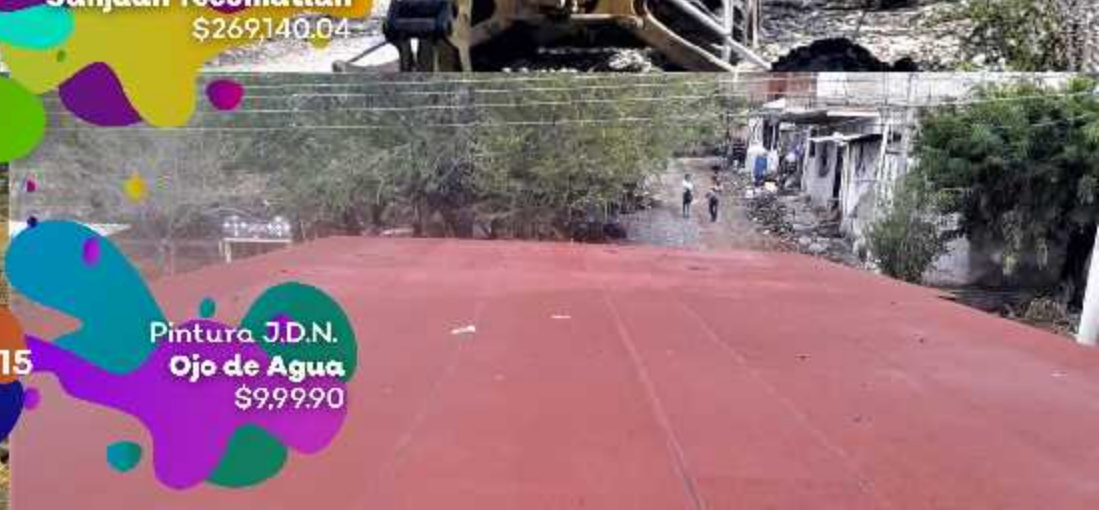
Pintura J.D.N. Ojo de Agua $9,999.90