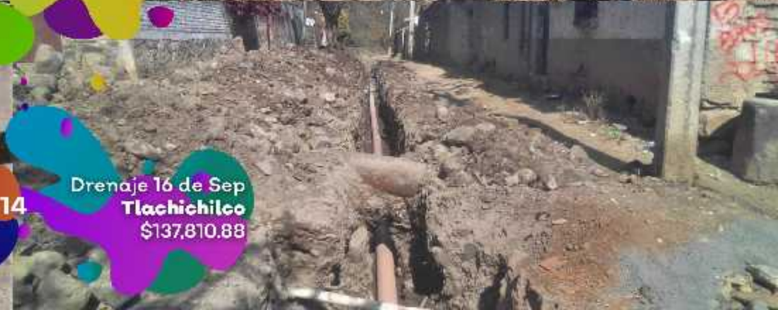
Drenaje 16 de Sep Tlachichilco $137,810.88