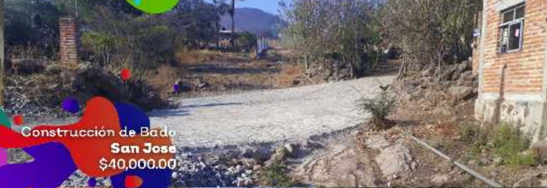
Construcción de Bado San Jose $40,000.00