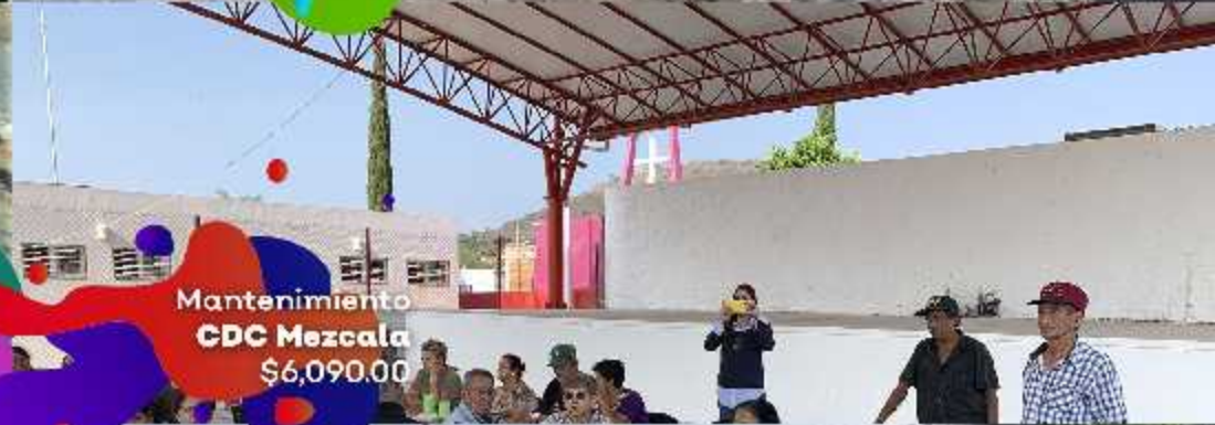
Mantenimiento CDC Mezcala $6,090.00