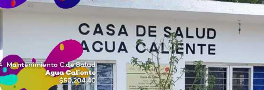
Mantenimiento C. de Salud Agua Caliente $50,204.40