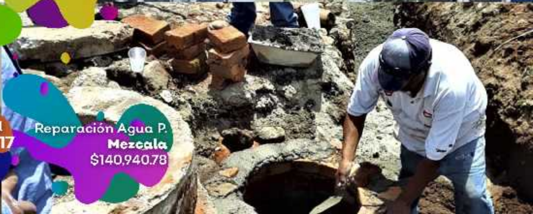
Reparación Agua P. Mezcala $140,940.78