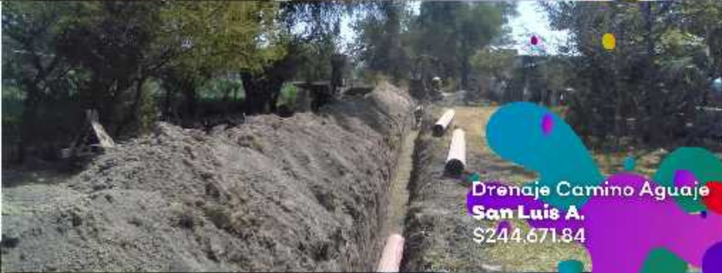
Drenaje Camino Aguaje San Luis A. $244,671.84