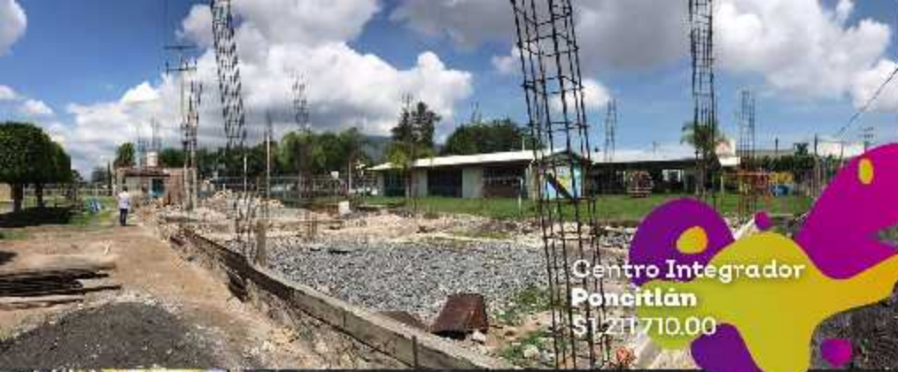
Centro Integrador Poncitlán $1,211,710.00