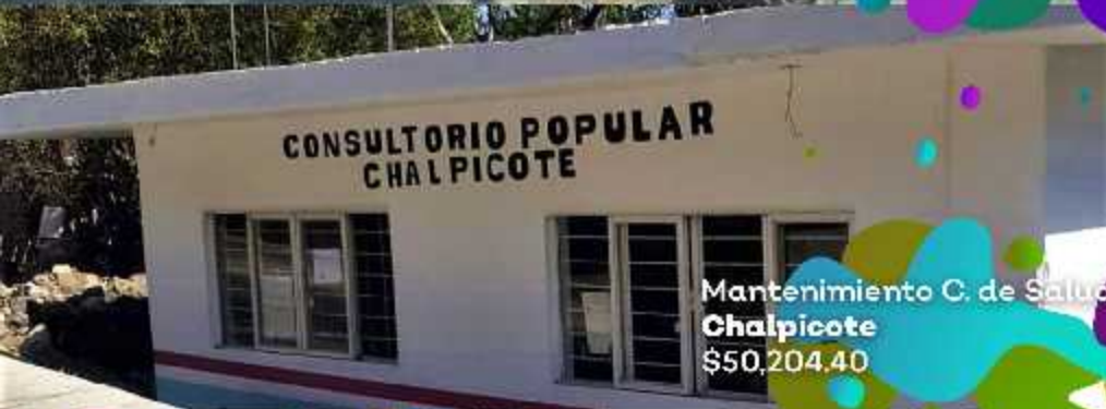
Mantenimiento C. de Salud Chalpicote $50,204.40