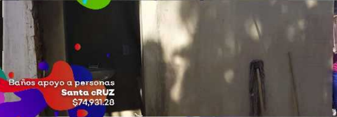
Baños apoyo a personas Santa Cruz $74,931.28