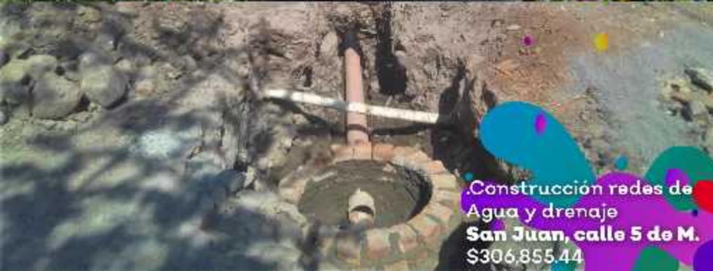
Construcción redes de Agua y drenaje San Juan, calle 5 de M. $306,855.44