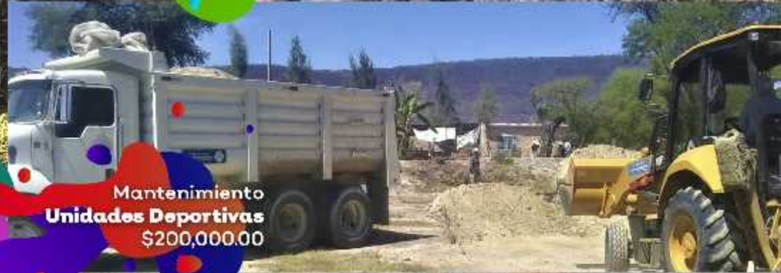
Mantenimiento Unidades Deportivas $200,000.00