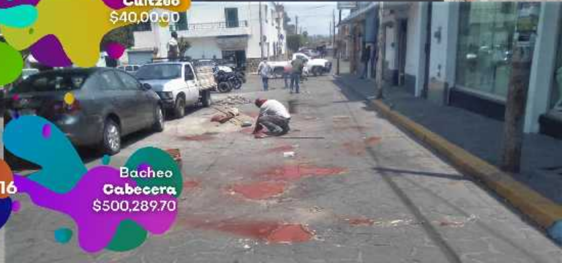
Bacheo Cabecera $500,289.70