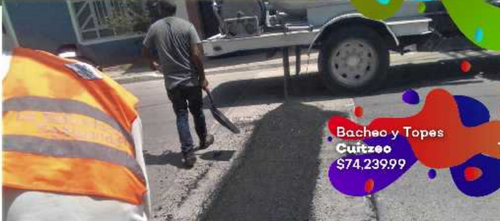
Bacheo y Topes Cuitzeo $74,239.99