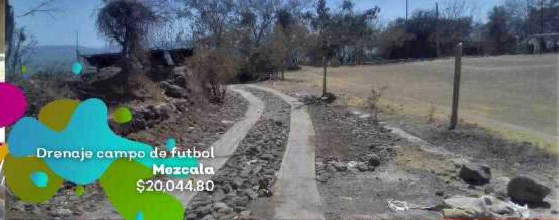
Drenaje campo de futbol Mezcala $20,044.80