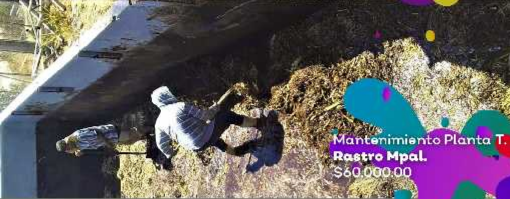
Mantenimiento Planta T. Rastro Mpal. $60,000.00