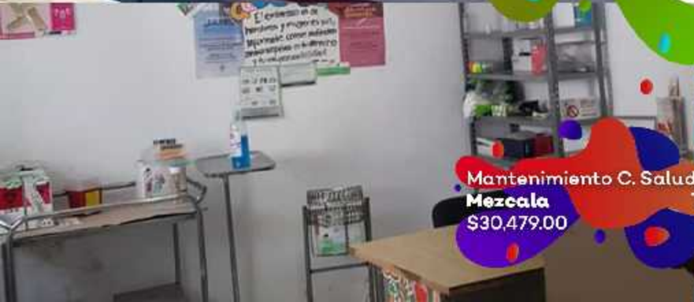
Mantenimiento C. Salud Mezcala $30,479.00