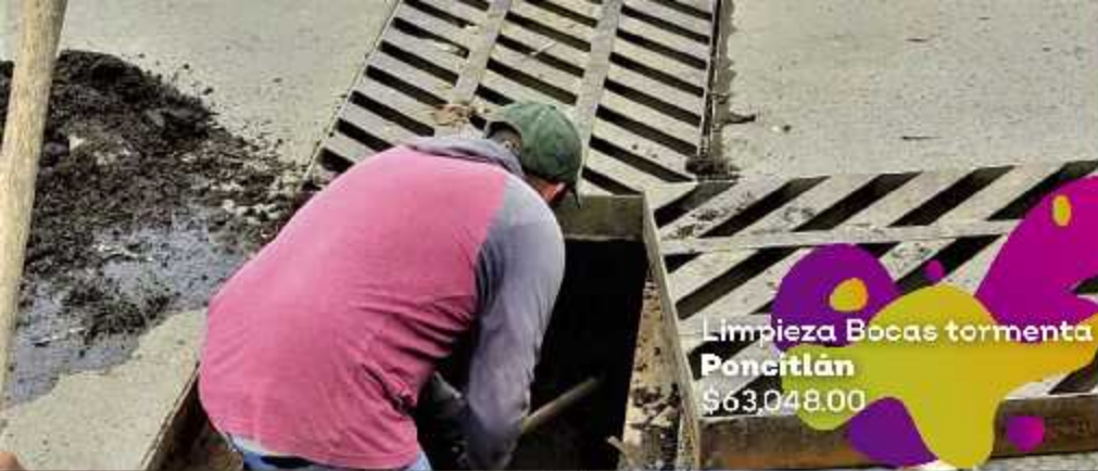
Limpieza Bocas tormenta Poncitlán $63,048.00