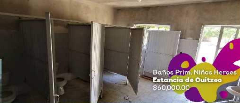
Baños Prim. Niños Heroes Estancia de Cuitzeo $60,000.00