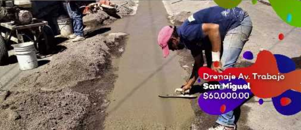
Drenaje Av. Trabajo San Miguel $60,000.00