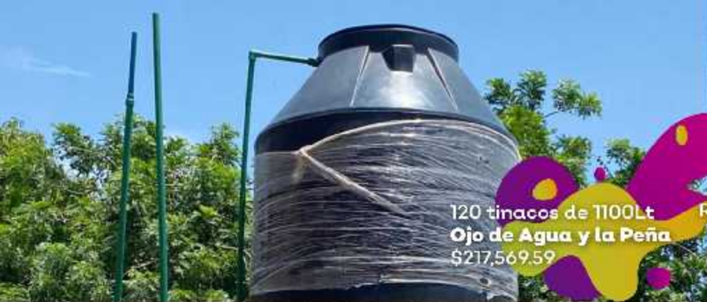
120 tinacos de 1100Lt Ojo de Agua y la Peña $217,569.59