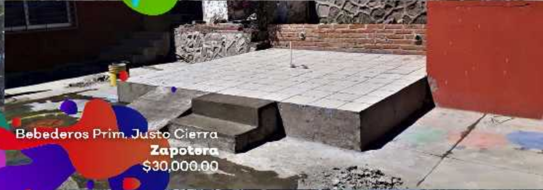
Bebederos Prim. Justo Cierra Zapotera $30,000.00