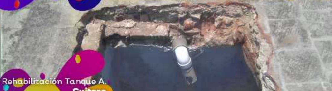
Rehabilitación Tanque A. Cuitzeo $40,000.00