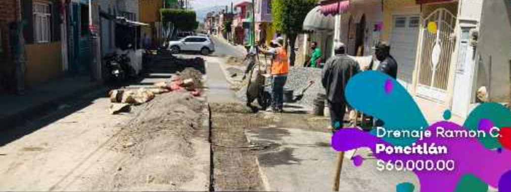
Drenaje Ramon C. Poncitlán $60,000.00