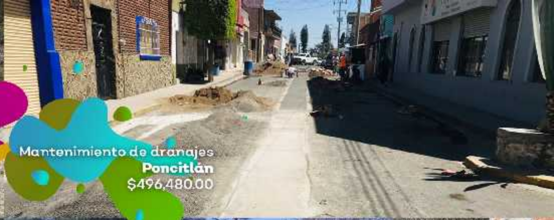
Mantenimiento de drenajes Poncitlán $496,480.00