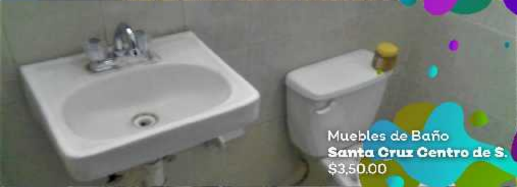
Muebles de Baño Santa Cruz Centro de S. $3,500.00