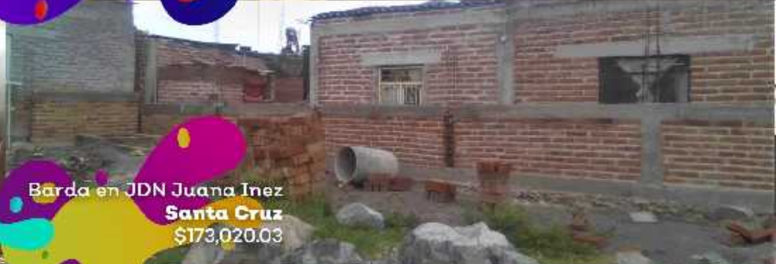
Barda en JDN Juana Inez Santa Cruz $173,020.03