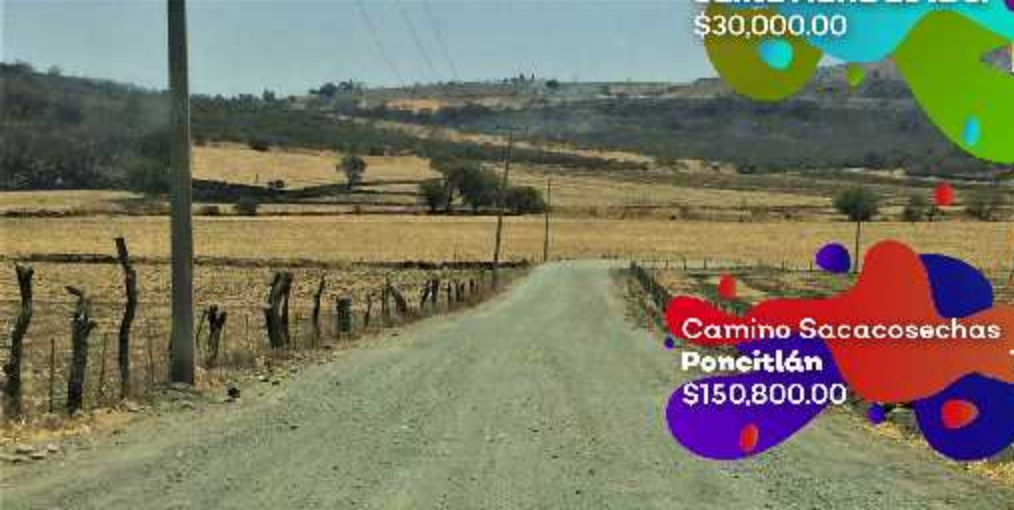
Camino Sacacosechas Poncitlán $150,800.00