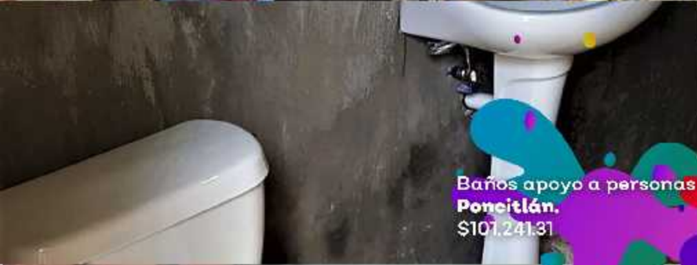
Baños apoyo a personas Poncitlán. $101,241.31