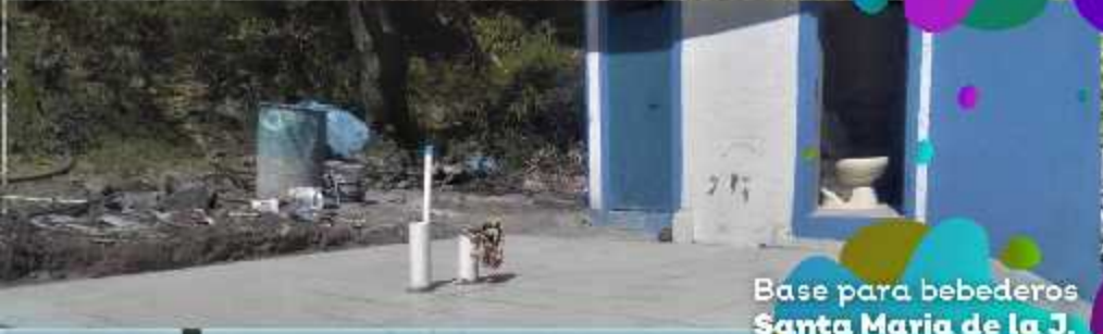
Base para bebederos Santa Maria de la J. $30,000.00