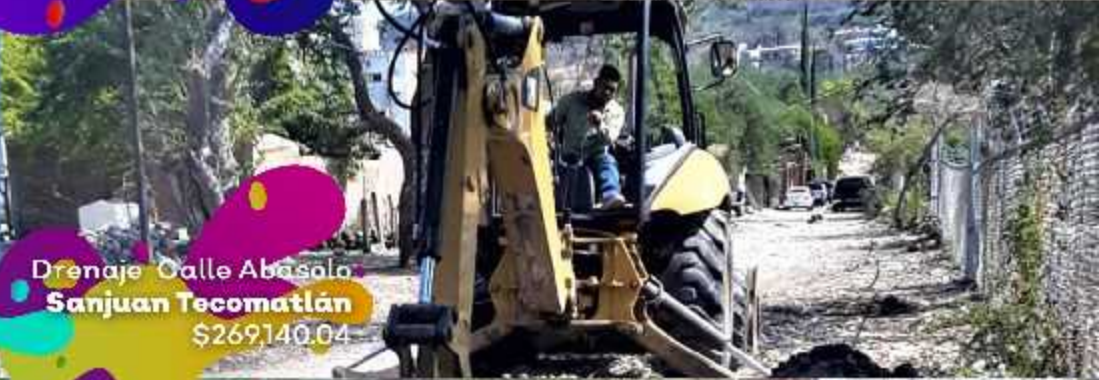
Drenaje Calle Abasolo Sanjuan Tecomatlán $269,140.04