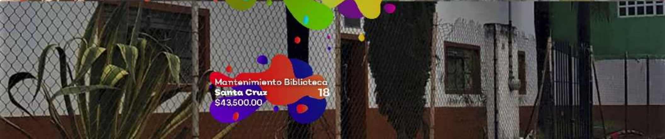
Mantenimiento Biblioteca Santa Cruz 18 $43,500.00