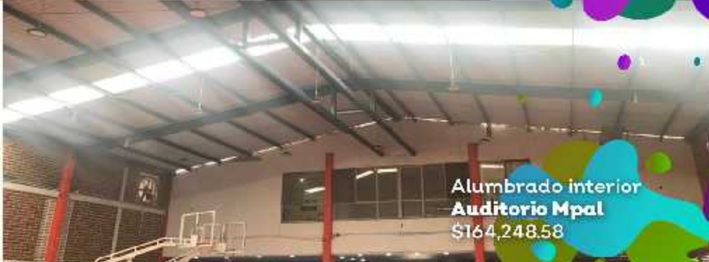
Alumbrado interior Auditorio Mpal $164,248.58