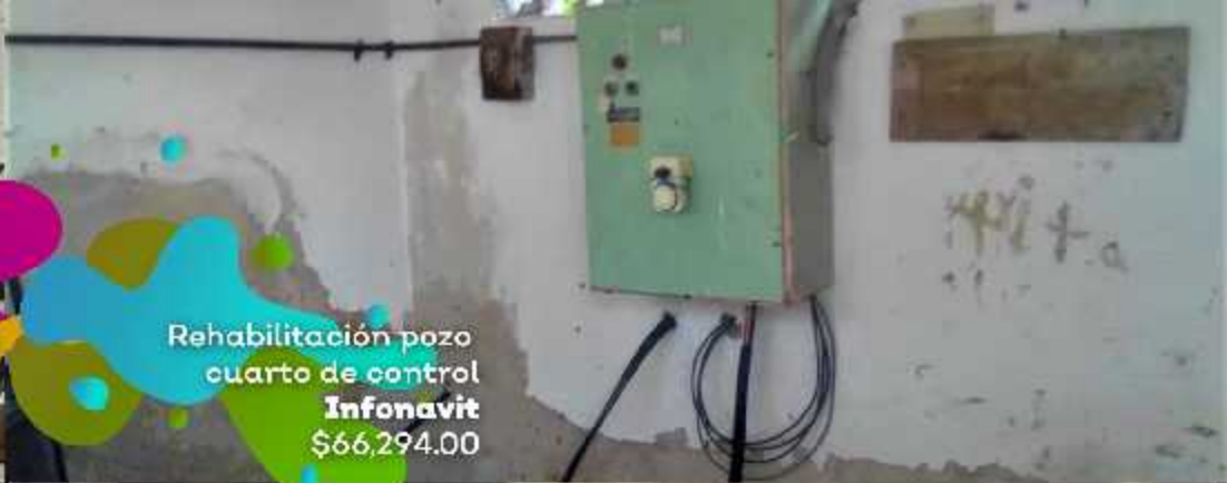
Rehabilitación pozo cuarto de control Infonavit $66,294.00