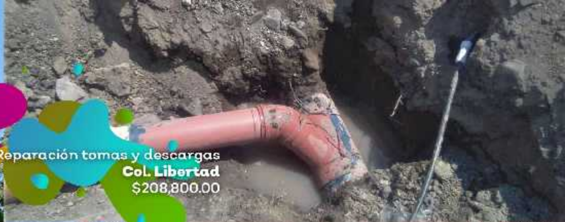
Reparación tomas y descargas Col. Libertad $208,800.00